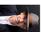
SHIGEO KATAOKA (JAPÓN): «MORFOLOGÍA DEL DIENTE PARA PRÓTESIS ESTÉTICAS»

Para conseguir una cavidad bucal y un rostro naturales y armoniosos, es necesario reproducir la «morfología» y el «tono» de los dientes naturales. Cuando se habla de morfología, el tamaño, la longitud y la relación posicional del diente son importantes. También es fundamental la simetría derecha e izquierda del diente. Es importante también reproducir las «características de la superficie» expresando la «textura» del diente. No existe un único patrón para conseguir que la forma del diente y la línea de la sonrisa (relación posicional de los dientes) armonicen con el rostro del paciente, sino que son posibles distintas combinaciones. Antes de crear la prótesis definitiva, hay que dedicar suficiente atención al modelo diagnóstico y a la restauración provisional. De esta forma, la prótesis conseguirá una armonía natural con los rasgos faciales. El tema de la charla es cómo reproducir la morfología del diente natural en la prótesis estética. Se mostrarán casos clínicos de carillas laminadas, cerámica prensada, coronas de zirconio y prótesis para implantes.